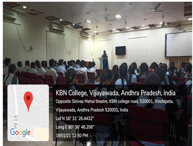
Faculty and Students participated in Guest Lecture