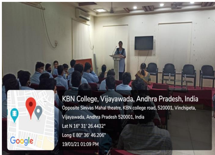
Students giving their feedback on Guest Lecture