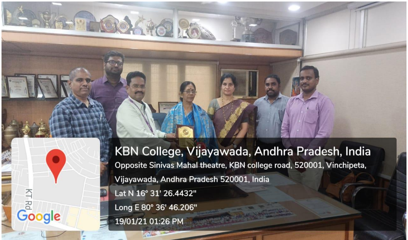
Felicitation to the Resource Person by the Principal and PG Directors